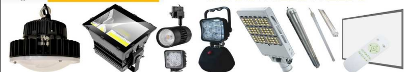
Projecteurs Interieur Exterieur Tunnels Public Lampes Tubes Reglettes Dalles

SYSTEMES D'ECLAIRAGES INDUSTRIELS A LEDS